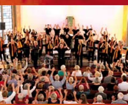
Danke für die Kollekte in Höhe von 1.400 Euro beim Benefizkonzert von N-joy